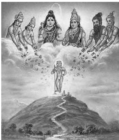
De zeven rishi's die met Manu de vloed overleefd hebben, afgebeeld boven de berg vanwaar zij de aarde opnieuw bevolkten.

Slechts één thema zien we terug op ieder continent, in alle gebieden, en onder ieder volk: de wereldwijde vloed.