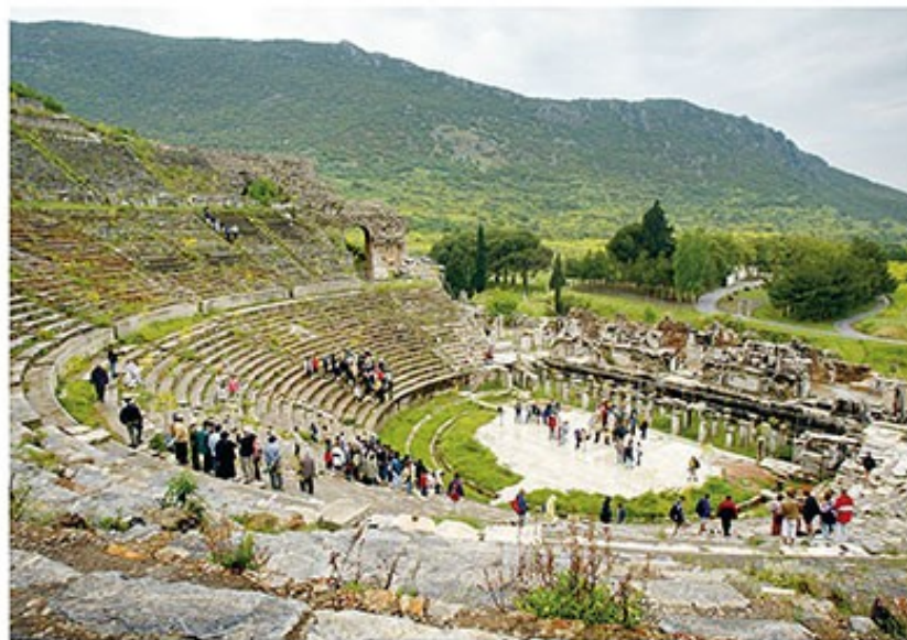
Restanten van het theater van Éfeze (zie ook Hand. 19:29)