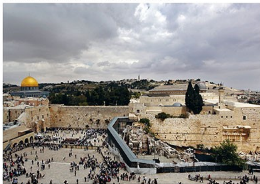
De Tempelberg in Jeruzalem. In het jaar 538 voor Christus keert een deel van het volk Israël terug uit ballingschap (Ezra 1-2). De tempel wordt herbouwd en de eredienst hervat (Ezra 5-6).